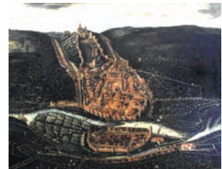
Fig. 1 : Epinal (88), vue cavalière de la ville en 1626, par N. Bellot

La partie reconnue dans l'emprise de la fouille menée par l'Inrap en 2006 concerne un segment du mur de courtine nord et le bastion nord-ouest appelé bastion Saint-Pierre. Ce dernier comportait deux casemates enterrées, bâties sur deux niveaux, ainsi qu'un magasin à poudre construit en son centre. Ces casemates étaient accessibles depuis un long couloir voûté en plein cintre débouchant à la surface de la citadelle ; elles étaient reliées entre elles par un couloir similaire passant dans l'épaisseur du rempart du bastion. La fouille a permis de vérifier que l'état initial