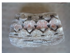
Élément d'arcature, de style outhonien, retrouvé dans la maçonnerie de la citadelle, avec la peinture originelle encore conservée.

1552 marque un virage dans la vie de la cité messine. La prise de Metz par le roi de France Henri II et l'échec de la contre-offensive de Charles Quint suite au siège qu'il a imposé à la ville à partir du mois de novembre de la même année a montré les limites de ses fortifications médiévales. Ce constat conduit le monarque français à renforcer ses défenses. Le projet d'une citadelle vient de l'architecte italien Rocco Guerinio, qu'il réalise à partir de 1560. Le plan de l'édifice est presque carré avec un bastion à chaque angle. Il est isolé de l'environnement urbain par un profond fossé large de plusieurs dizaines de mètres. L'ensemble devait être très imposant puisque le sommet du grand cavalier surplombait le fond du fossé de 32 mètres.