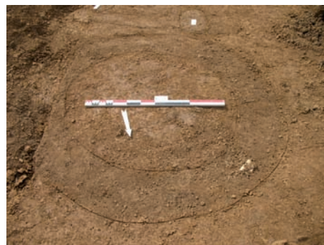
Position d'artillerie antiaérienne de la Grande Guerre. Découverte à Sorcy-Saint-Martin (Meuse).

Enfin, la fouille des sites bouleversés par les conflits armés des XIX e et XX e siècles reste dangereuse tant la présence de munitions est dense. Il ne faut pas croire que le temps annihile la dangerosité des munitions. Au contraire, il amplifie les risques d'explosion lors de manipulation ou de choc, par le phénomène de corrosion des systèmes d'allumage des explosifs devenus