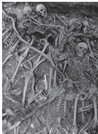
Détail de la sépulture multiple de Saint-Rémy-la-Calonne (Meuse). Soldats français du 288 e R.I. disparus le 22 septembre 1914.

Cette sépulture qui contenait 21 soldats français disparus lors d'un combat le 22 septembre 1914, fut en effet la première opération archéologique officielle de ce type en France. Bien que d'abord déconcertés, voire réticents à fouiller et étudier des vestiges aussi récents, les archéologues ont petit à petit intégré ce nouveau champ chronologique à leur discipline. Pour ce faire, ils travaillent en collaboration avec les historiens mais aussi avec les acteurs des disciplines connexes telles que l'anthropologie, la zoologie, la parasitologie, la céramologie, l'uniformologie. Parallèlement, les aménagements du territoire (autoroutes, ZAC, lotissements, TGV...) et la recrudescence des pillages des champs de batailles par les utilisateurs de détecteurs de métaux, conduisant à la destruction irrémédiable des sites et des vestiges militaires enfouis, s'accéléraient. Il devenait urgent de prendre en compte le sauvetage et l'étude de ce patrimoine en danger.