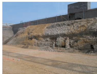
Mur de courtine, avec l'emplacement du couloir descendant au cœur du bastion et passant dans l'épaisseur du rempart.