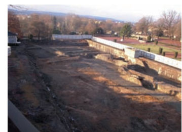
Vue générale des vestiges de la Citadelle.