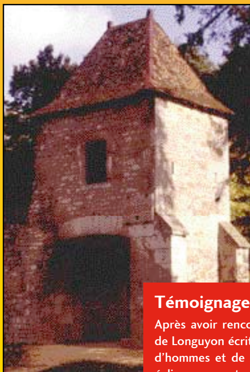
La Porte de France à Vaucouleurs

Faisant suite aux rencontres de Châtel-sur-Moselle, Rodemack et Sarreguemines, la quatrième journée «visite-rencontre des acteurs» s'est déroulée le samedi 24 septembre 2005 dans le secteur de Vaucouleurs. Une trentaine d'acteurs venus de toute la région ont pu rencontrer d'autres acteurs du sud-ouest de la Lorraine.