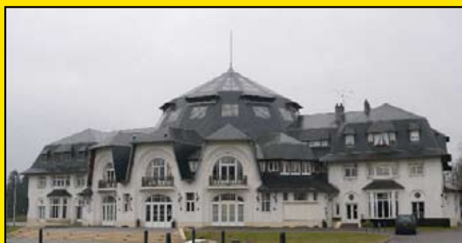
Thaon-les-Vosges : la Rotonde