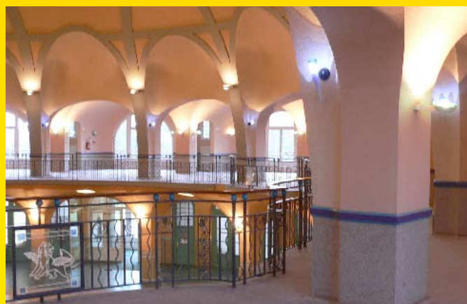
La Rotonde de Thaon-les-Vosges – Galerie du 1 er étage

La rencontre annuelle de tous les acteurs aura lieu le dimanche 23 avril 2006 de 9h30 à 11h à la Rotonde de Thaon-les-Vosges, dans le cadre de la Journée d'Histoire Régionale.